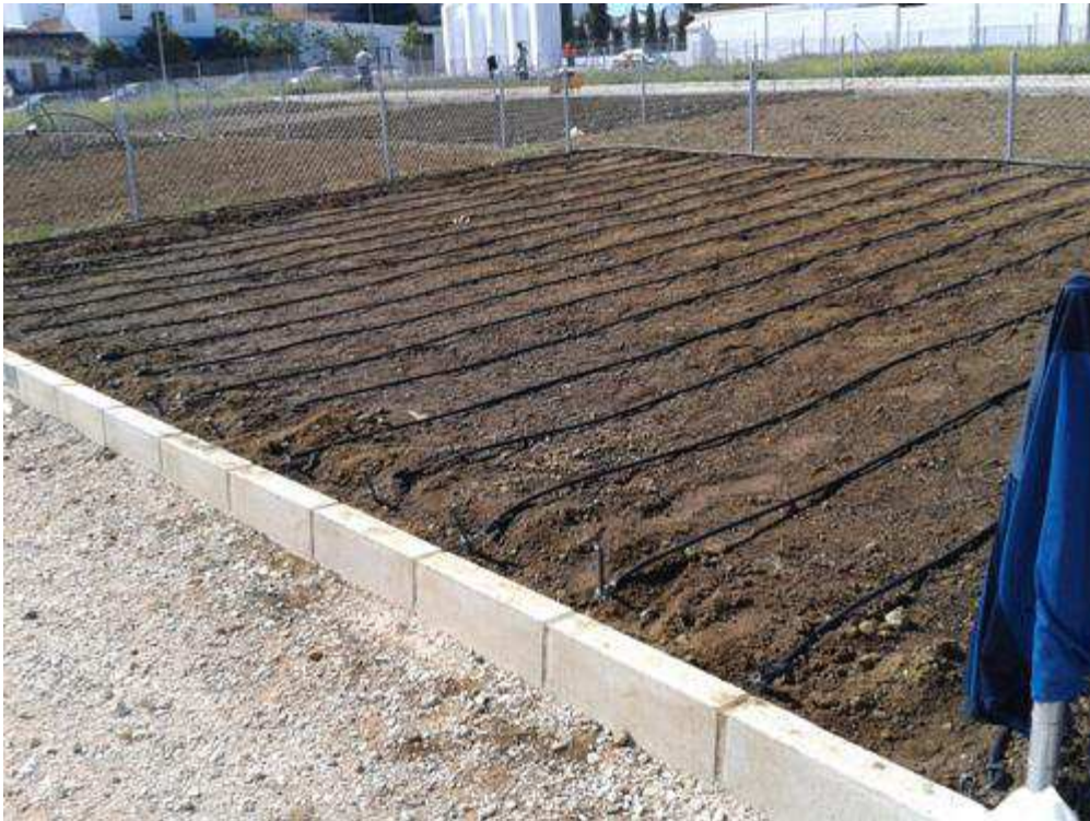
Imagen durante la ejecución de las instalaciones

La zona de actuación es sensiblemente rectangular, con el lado corto paralelo a Redonda de Ramón y Cajal, y el lado largo paralelo al muro oriental del Cementerio Municipal. Anteriormente esta parcela tenía escombros y la solera de una antigua nave en ruinas que ha sido necesario demoler. El solar no disponía de ningún servicio.