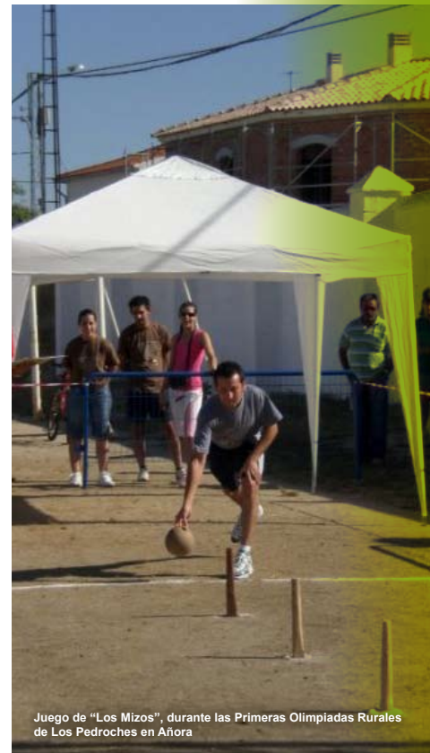
Juego de "Los Mizos", durante las Primeras Olimpiadas Rurales de Los Pedroches en Añora

En segundo lugar se considera la recuperación y difusión de prácticas tradicionales. Son actividades muy ligadas a la promoción turística que invitan a visitar el municipio. La matanza tradicional del cerdo, la muestra de artesanía y la feria de la tapa son actividades que se desarrollan en Espejo. En Añora se dieron las Primeras Olimpiadas Rurales de Los Pedroches , que recuperan juegos tradicionales en riesgo de desaparecer como la cucaña , la soga , los mizos , la carretilla , el pañuelo o pingané .