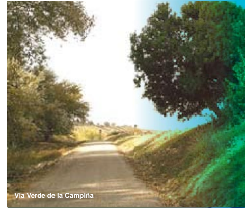
Vía Verde de la Campiña

La puesta en valor de otros elementos singulares distintos a la infraestructuras lineales es el objetivo de la línea estratégica I.I.E.2.. Incluye actuaciones de muy diversa índole y se centra en bienes con valores arqueológicos, arquitectónicos, naturales o paisajísticos. Un ejemplo fácilmente identificable es el de la Guía del Patrimonio Hidráulico del Valle del Guadalquivir , editado por la Asociación para el Desarrollo Rural del Medio Guadalquivir. Considera puentes, aceñas, molinos, acequias, azudes, etc., pero también valores históricos o etnológicos que se expresan en acontecimientos que han dejado huella en la historia del río Guadalquivir.