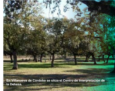
En Villanueva de Córdoba se sitúa el Centro de Interpretación de la Dehesa.

Las líneas estratégicas segunda y tercera plantean objetivos muy similares, centrados en la divulgación de los valores ecológicos de la provincia. La primera de ellas incluye inventarios de flora y fauna y ferias agrícolas, como la Feria Agrícola de la Biodiversidad en Priego de Córdoba. Por su parte, en la línea I.I.B.3. destacan los equipamientos de uso público relacionados con la biodiversidad. Es el caso del Centro de Interpretación de la Dehesa en Villanueva de Córdoba.