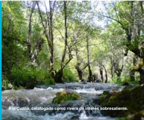
Río Cuzná, catalogado como rivera de interés sobresaliente.

3. BIENES NATURALES COMUNES. Nos hemos comprometido a asumir completamente nuestra responsabilidad para proteger, preservar y garantizar un acceso equitativo a los bienes naturales comunes.