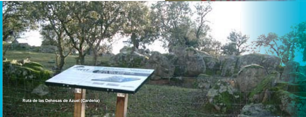
Ruta de las Dehesas de Azuel (Cardena)

3. BIENES NATURALES COMUNES. Nos hemos comprometido a asumir completamente nuestra responsabilidad para proteger, preservar y garantizar un acceso equitativo a los bienes naturales comunes.