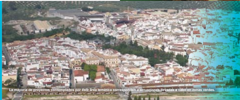
La mayoría de proyectos contemplados por este área temática corresponden a actuaciones llevadas a cabo en zonas verdes.

5. PLANIFICACIÓN Y DISEÑO URBANÍSTICO. Nos hemos comprometido a asumir un papel estratégico en el diseño y planificación urbana y a enfocar los temas ambientales, sociales, económicos, de salud y culturales hacia el beneficio común.