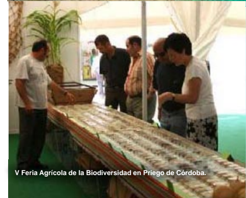
V Feria Agrícola de la Biodiversidad en Priego de Córdoba.