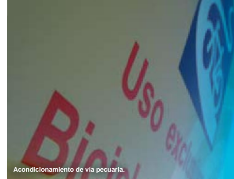
Acondicionamiento de vía pecuaria.