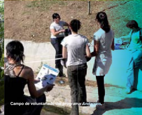
Campo de voluntariado del programa Andarriós .