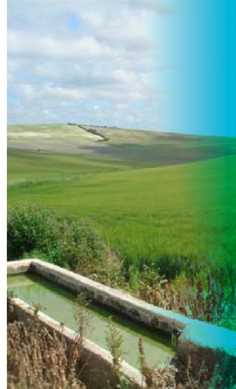
www.conocetusfuentes.com es el portal donde se están inventariando las fuentes de la comunidad andaluza.

El programa Andarriós está impulsado por la Dirección General de Desarrollo Sostenible e Información Ambiental de la Consejería de Medio Ambiente en colaboración con la Agencia Andaluza del Agua y la Confederación Hidrográfica del Guadalquivir. Aúna estudios de calidad en cauces fluviales y actuaciones de regeneración con educación ambiental a través de campos de voluntariado.